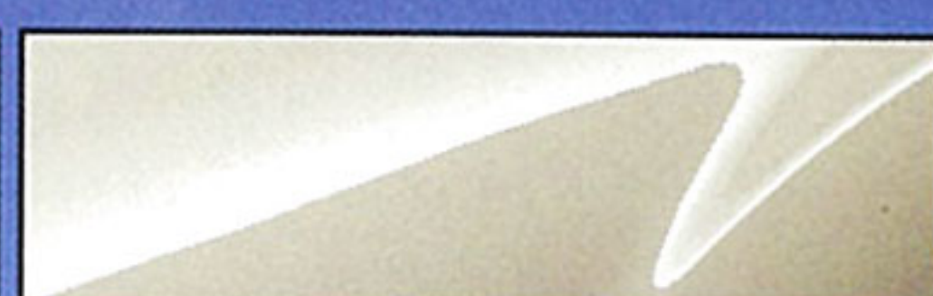
マーブルホワイト (ソフトトップモデルのみ)