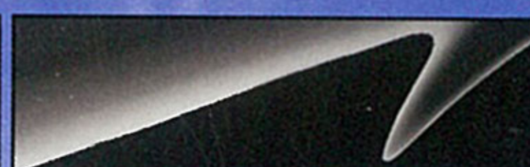
ブリリアントブラック