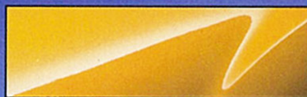
サンフラワーイエロー