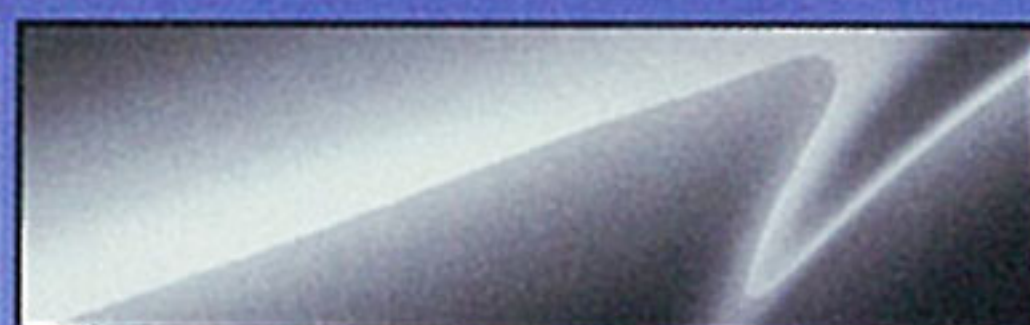
メトロポリタングレーマイカ