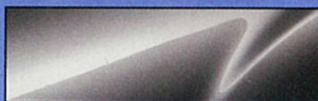
アルミニウムメタリック