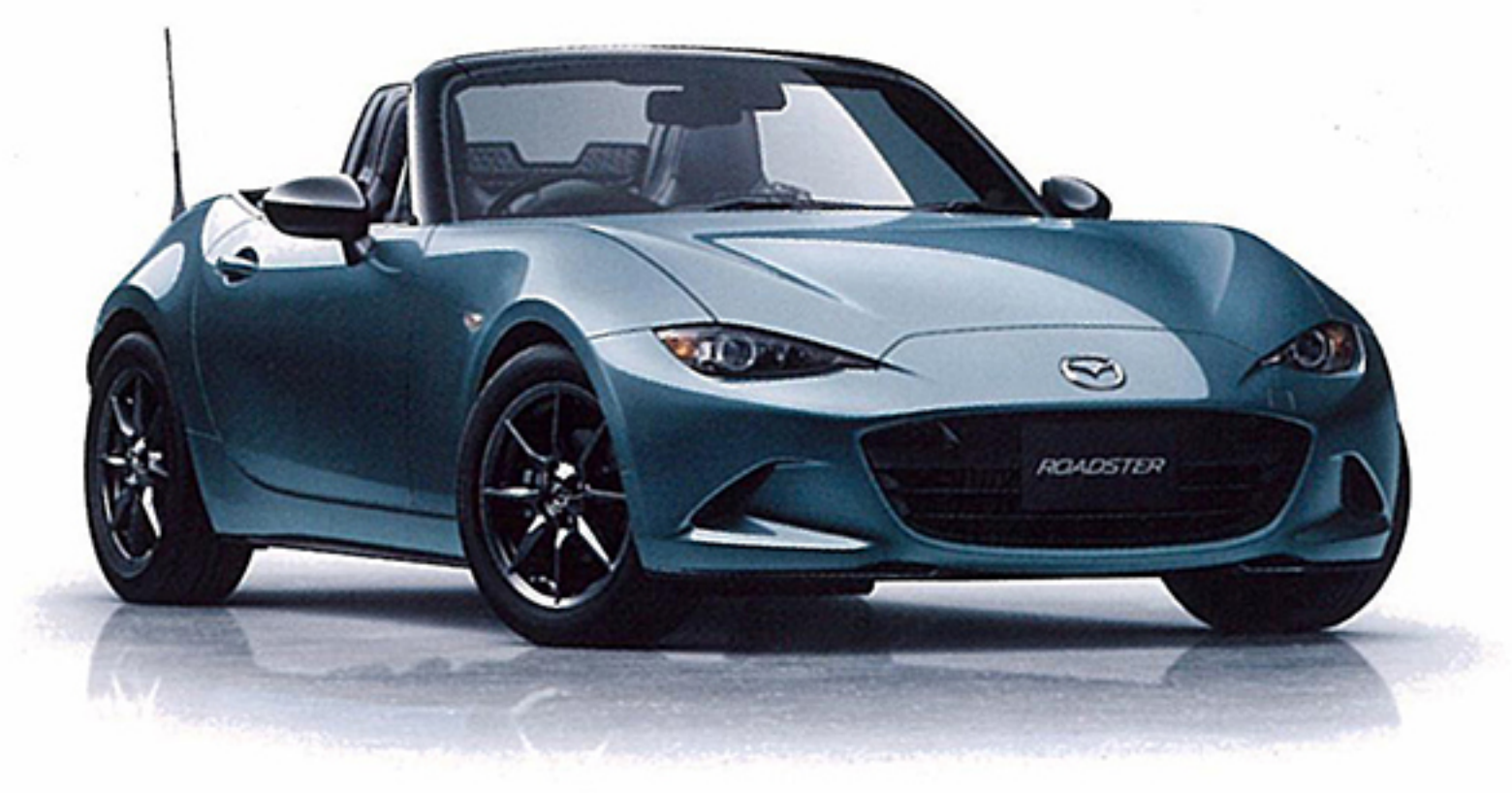
BLUE REFLEX MICA ブルーリフレックスマイカ

※1 ソウルレッドプレミアムメタリックは特別塗装色のため、 メーカー希望小売価格54,000円(消費税抜き価格50,000円)高となります。 ※2 クリスタルホワイトパールマイカは特別塗装色のため、 メーカー希望小売価格32,400円(消費税抜き価格30,000円)高となります。