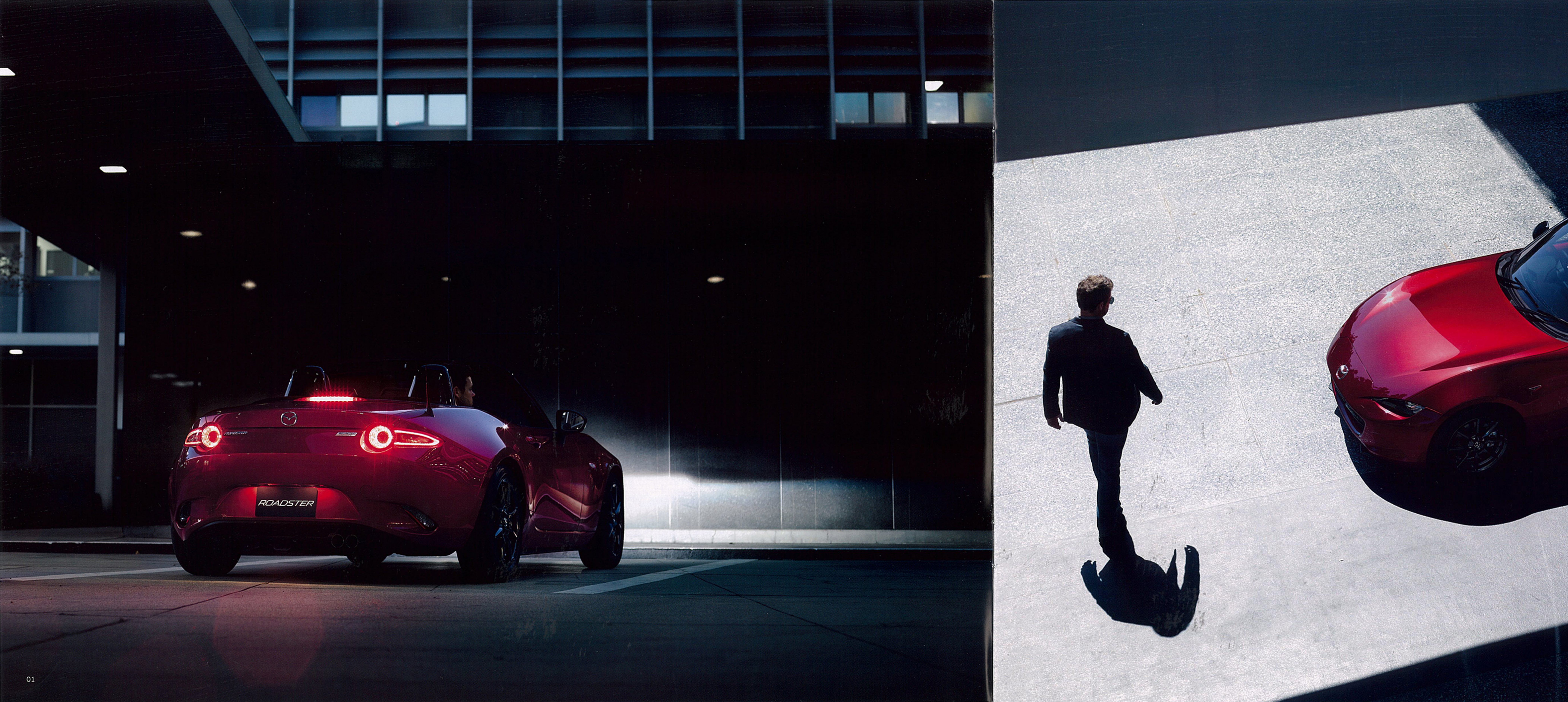
Photo:S Leather Package (MT車) Body Color:ソウルレッドプレミアムメタリック Seat:本革<sup>並</sup>(ブラック) ※シート背もたれの前面、サイドサポート部内側、シート座面、ヘッドレスト前面に本革を使用しています。 *画像は市販予定車です。実際に販売される車両とは一部仕様が異なる場合があります。