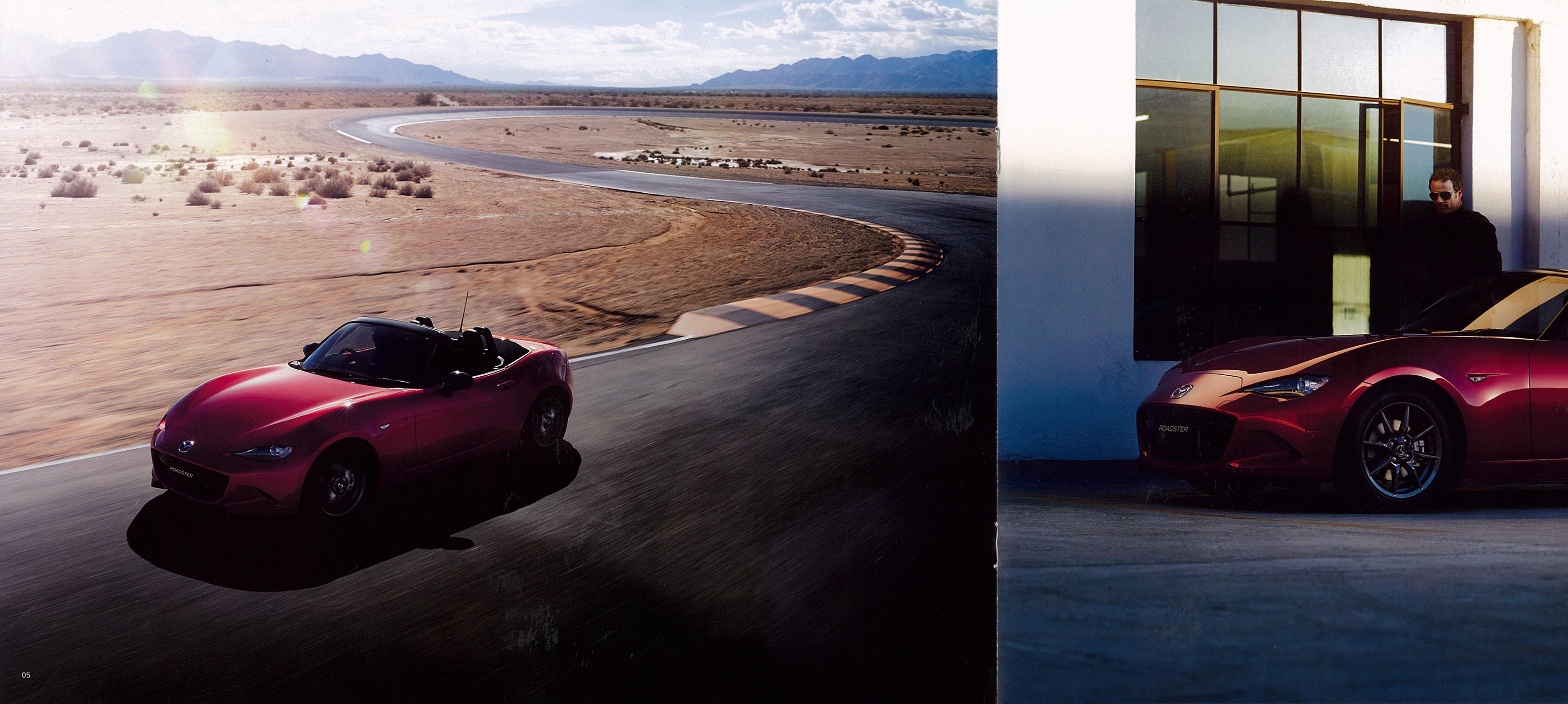
Photo:S Leather Package (MT車) Body Color:ソウルレッドプレミアムメタリック Seat:本革<sup>※</sup>(ブラック) ※シート背もたれの前面、サイドサポート部内側、シート座面、ヘッドレスト前面に本革を使用しています。 * 画像は市販予定車です。実際に販売される車両とは一部仕様が異なる場合があります。