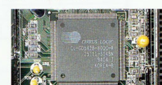
CL-GD5428 (CIRRUS LOGIC社製)