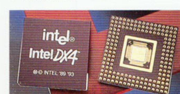
Intel DX4™(100MHz)

●ローカルバスとして、高い表示性能を実現するVLバスを2スロット(FMV-499D2/466D2/433sD2/425sD2)、最新の32ビットバス、PCIバスを2スロット(内1スロットはPCI/ISA兼用)装備(FMV-590D2)。またそれぞれISAバス×4(内2スロットはVLバス対応:FMV-499D2/466D2/433sD2/425sD2)、ISAバス×2(FMV-590D2)を標準装備しています。 ●本体前面の拡張ベイ×1スロットを用意(CD-ROM搭載モデルはCD-ROMドライブで使用済)。省スペースでのシステムの拡張が可能です。