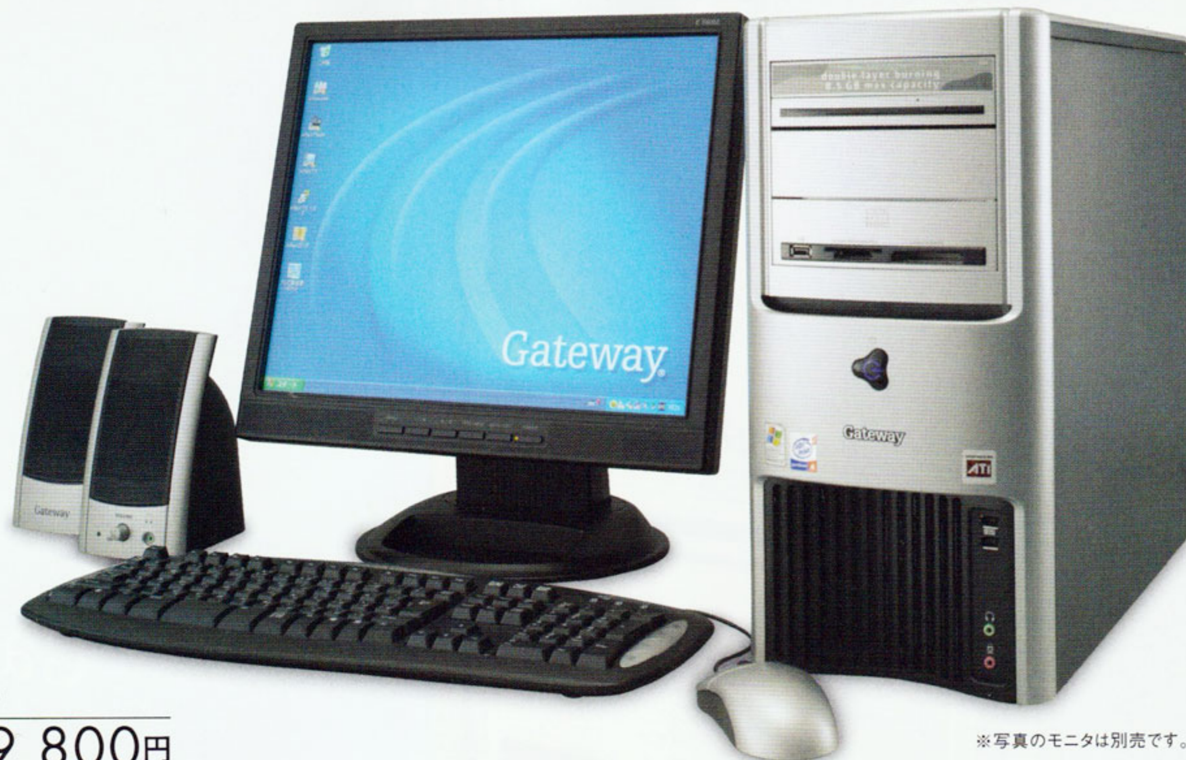
※写真のモニタは別売です。