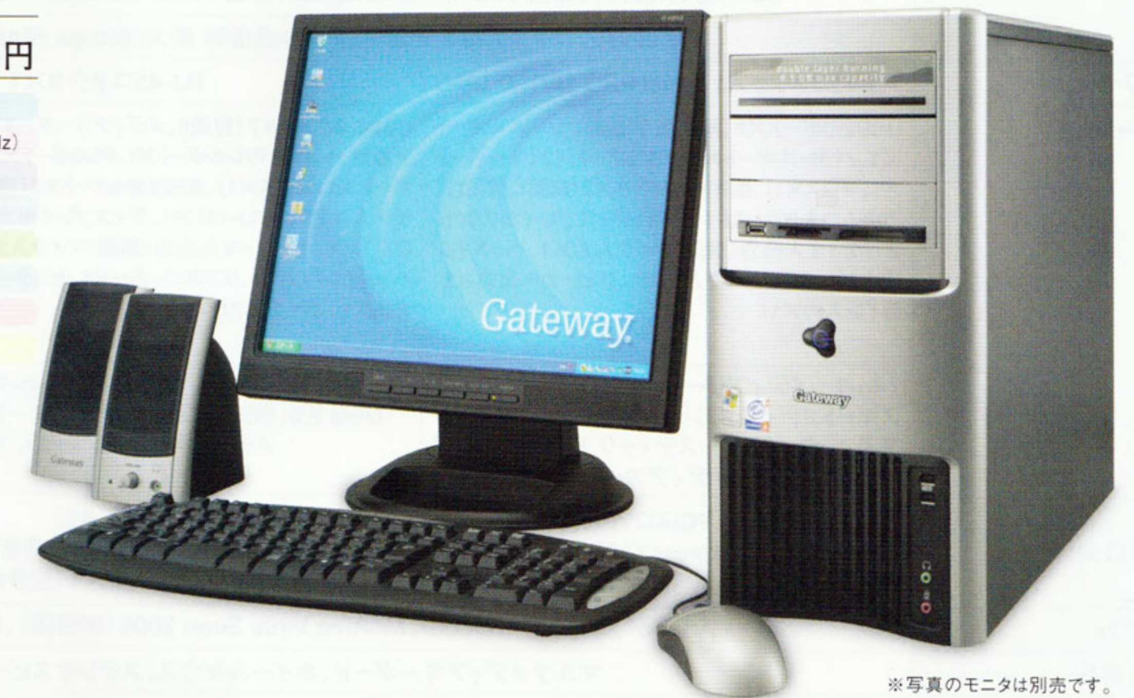
※写真のモニタは別売です。