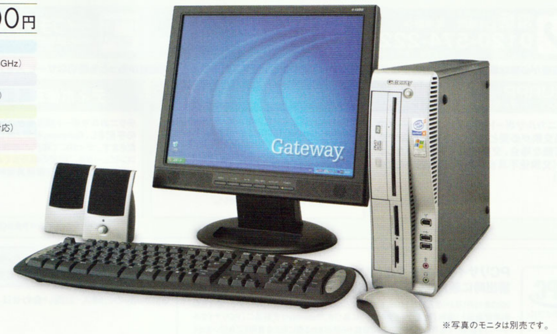
※写真のモニタは別売です。